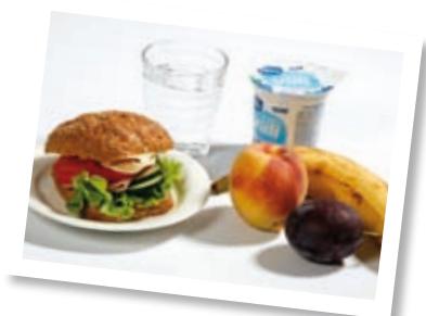
Lautasmalli s. 24