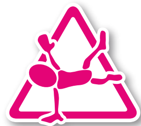
YourMove s. 15