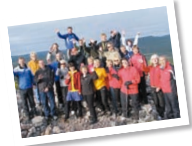
Kehittämisyhmät s. 12