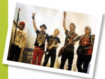
Näytöslaji s. 6