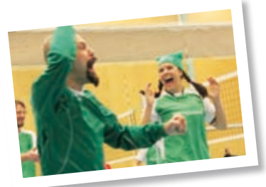
Kohdatut s. 21