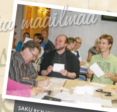
SAKU RY:N UUTTA STRATEGIAA VISIOI- TIIN MUUN MUASSA KEHITTÄMISRYHMIEN YHTEISESSÄ SEMINAARISSA.

UUSI VUOSI AVASI SAMALLA MYÖS UUDEN STRATEGIAKAUDEN SAKU RY:N TOIMINNASSA. JÄSENISTÖ HYVÄKSYI SYYSKOKOUKSESSA JÄRJESTÖN UUDEN VISION ”SAKU RY ON HYVINVOINNIN EDISTÄMISEN TÄRKEÄ KUMPPANI AMMATILISESSA KOULUTUKSESSA”. TÄTÄ VUOTEEN 2016 TÄHTÄÄVÄÄ VISIOTA LÄHDETTÄÄN TAVOITTELEMAAN UUDEN STRATEGIAN KEINOVALIKOIMALLA.