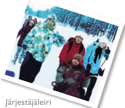
Järjestäjäleiri s. 8