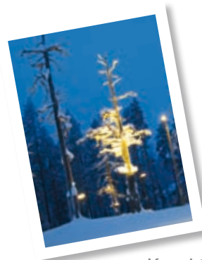
Kuerkievari s. 6