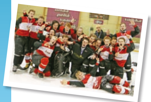
Kaukalopallo s. 14