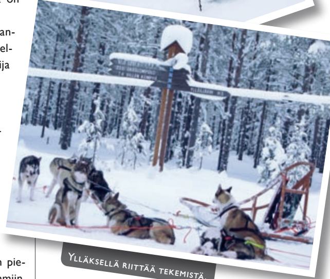
YLLÄKSELLÄ RIITTÄÄ TEKEMISTÄ.

-Kokouksiin Kuerkievari tarjoaa rauhallisen ympäristön. Kokouksen tauoille voi halutesaan esimerkiksi tilata ohjatun lumikenkäretken, kavuta Kuertunturin laelle tai nauttia oma-toimisesta luonnossa liikkumisesta. Ruokalistaa uskallan kehua myös huoletta, kun keittiöstä vastaa ravintola Haltiakammen henkilökunta.