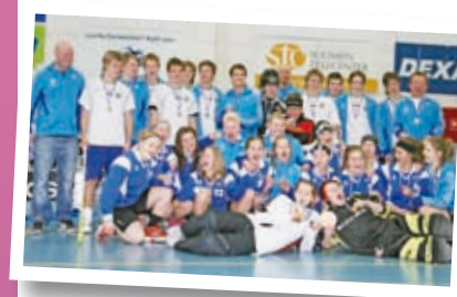
OSAO liikkeellä 20