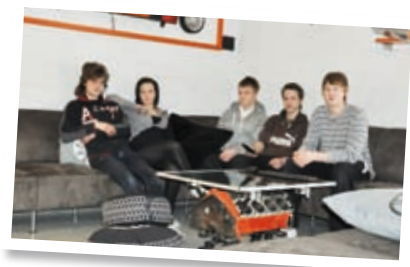
Vapaa-ajan tilat 10