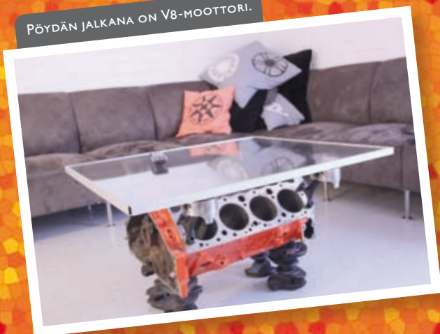
PÖYDÄN JALKANA ON V8-MOOTTORI.

Olohuone on täynnä oivalluksia. Lasipöydän jalkana pilkistää V8-moottori. Pakoputki on lennähtänyt kattoon. Tunnelmavalot syttyvät auton valosarjasta. Matto on kuin maantie, joka päättyy luonnollisesti suojatiehen. Autoalan vapaa-ajan tila on olohuone, johon ei marssita kengät jalassa tai työhaalareissa peremmälle.