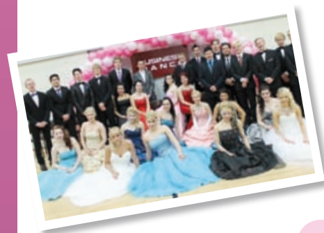
Business Dance 25