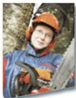
Luonnonvara- ja ympäristöala