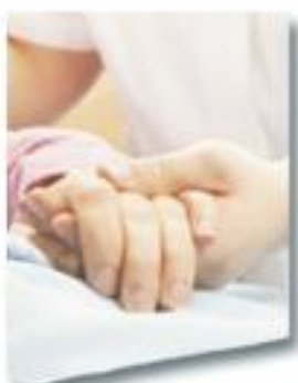
Sosiaali-, terveys- ja liikunta-ala