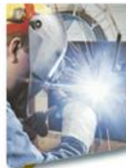
Tekniikan ja liikenteen ala