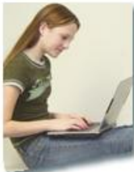
Yhteiskuntatieteiden, liiketalouden ja hallinnon ala