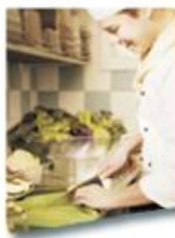
Matkailu-, ravitsemis ja talousala