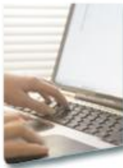
Luonnon- tieteiden ala