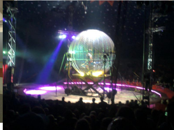
Sirkus Finlandiaa katsomassa