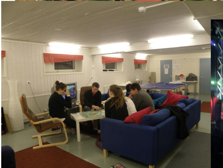
Cellari vapaa-ajan tila -peli-ilta