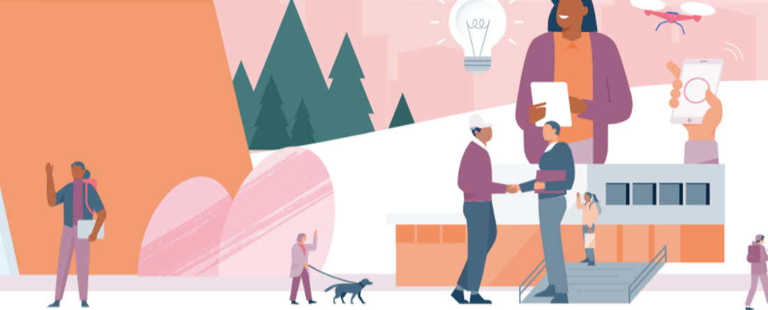
Elinkeino ja työllisyys