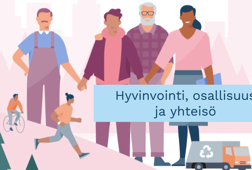
Hyvinvointi, osallisuus ja yhteisö