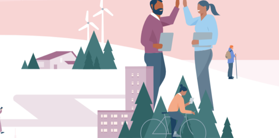
Kehittäjä ja kumppani